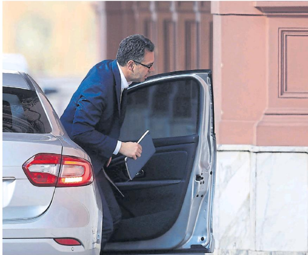
Guido Sandleris, presidente del BCRA, al entrar ayer en la Casa Rosada